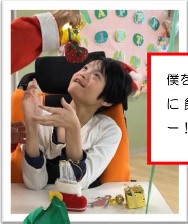
僕をきれいに飾ってー！