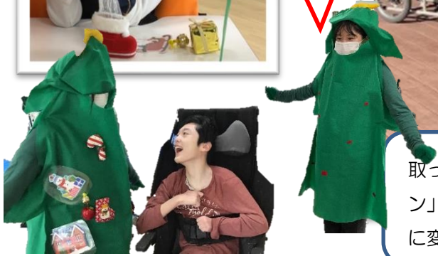
取ったオーナメントを「ツリーマン」にくっつけて、素敵なツリーに変身させるよ！！