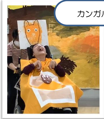
カンガルーの親子跳び