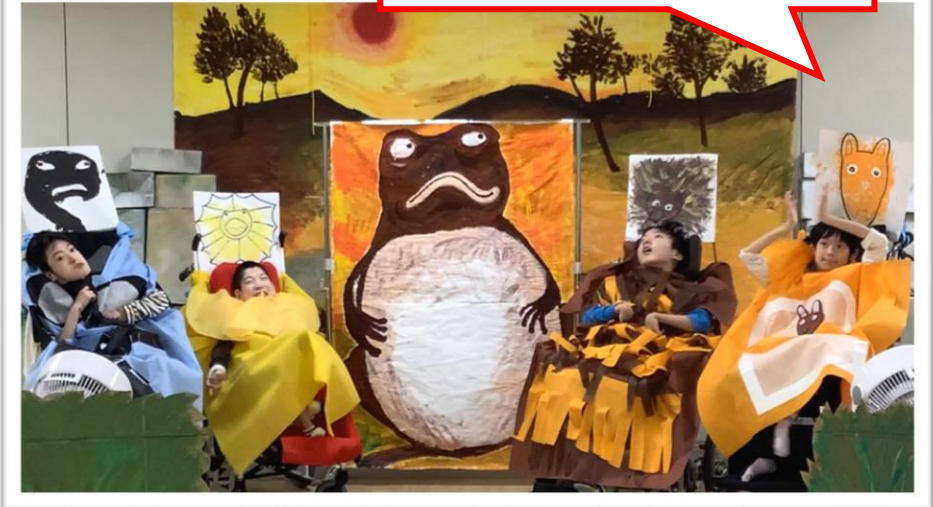
お願いティダリク～お水返して～。